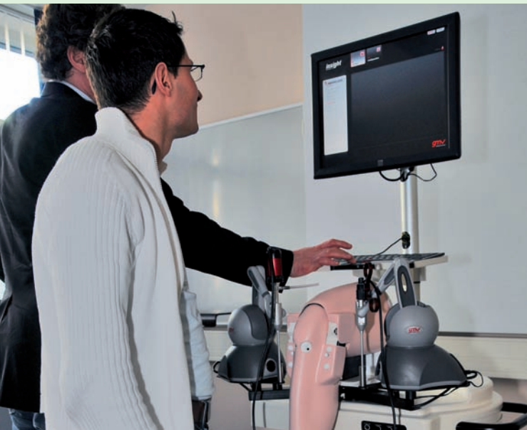
Arthroskopie am VR-Simulator

📍 Sporthopaedicum Straubing, AGA Instructor