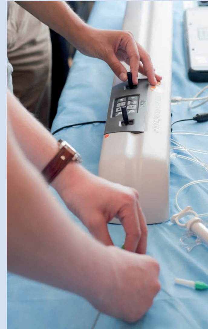
Transradiale Intervention am Simulator