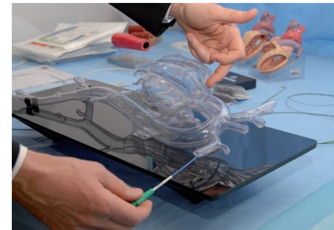
Training am Modell